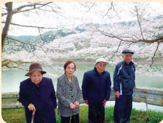
今年も見れた! また来年♡