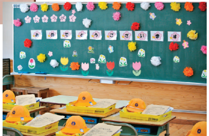
（写真：武雄小学校入学式 掲載許可承諾済）