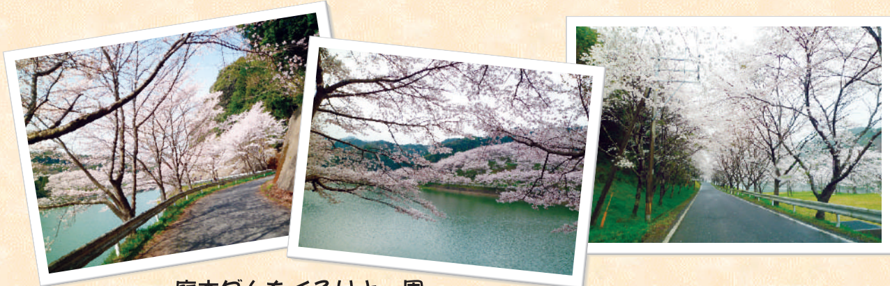
庭木ダムをぐるりと一周