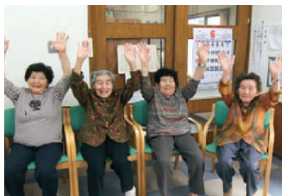
▲生きがい対応型デイサービス