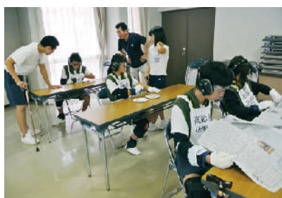
▲ボランティアスクール