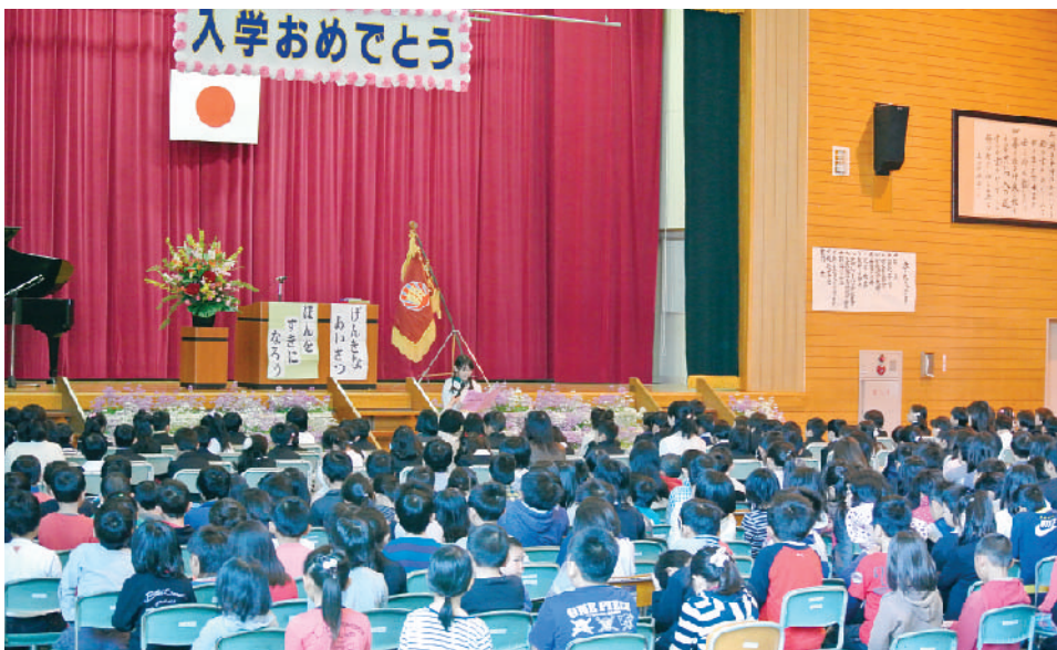
（写真：朝日小学校入学式 掲載許可承諾済）

武雄市社会福祉協議会では、子どもたちの交通安全を願い市内の全小学校の入学式で新一年生に「黄色いぼうし」をお届けしました。