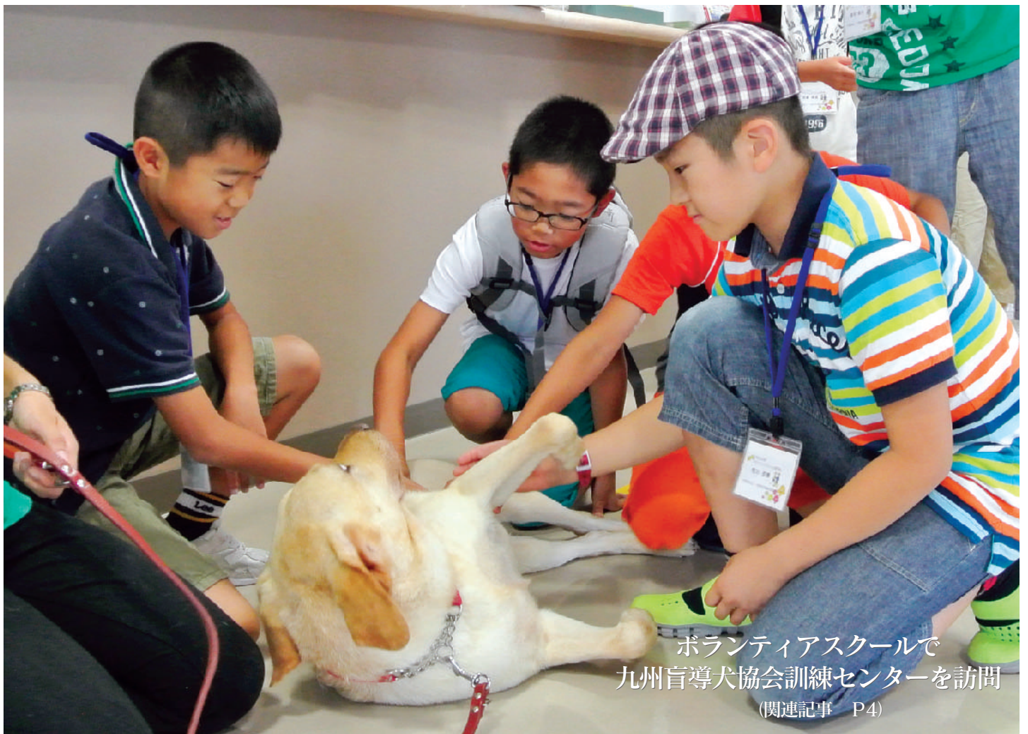
ボランティアスクールで 九州盲導犬協会訓練センターを訪問 (関連記事 P4)